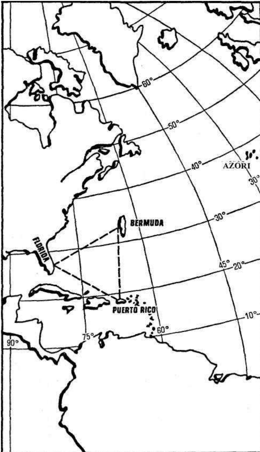
Pogled iz zraka na Bermudski trokut

„U ljeto 1968. godine, sa skupinom od deset ili dvanaest profesionalnih ronilaca, nakanio sam krenuti u potragu za potopljenim brodovima s blagom u području Bahama.