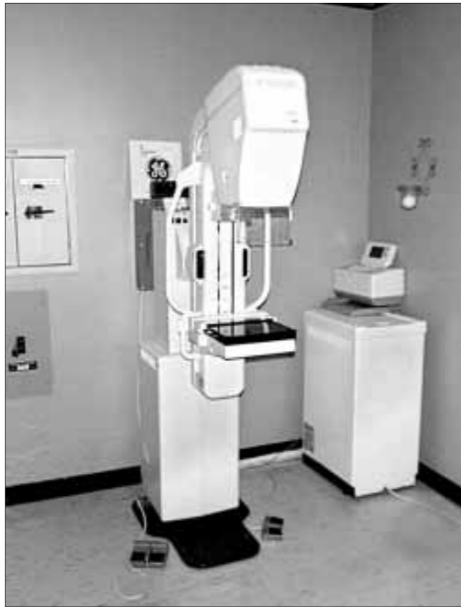
Mamografija je rendgensko zračenje (visokoenergetske x-zrake) dojki i to često u dozama tisuću puta većim (oko 1 rad) od onih koje se koriste pri snimanju pluća

Mamografija je rendgensko zračenje (visokoenergetske x-zrake) dojki i to često u dozama tisuću puta većim (oko 1 rad) od onih