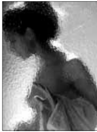
Uočena je povećana smrtnost kod žena koje su prakticirale »preventivno« rendgensko snimanje dojki

dina povećavaju rizik od pojave raka dojki. Posebno su mlade žene sklone razvoju raka izazvanog zračenjem dojki. Osim toga, oko 2 pos-