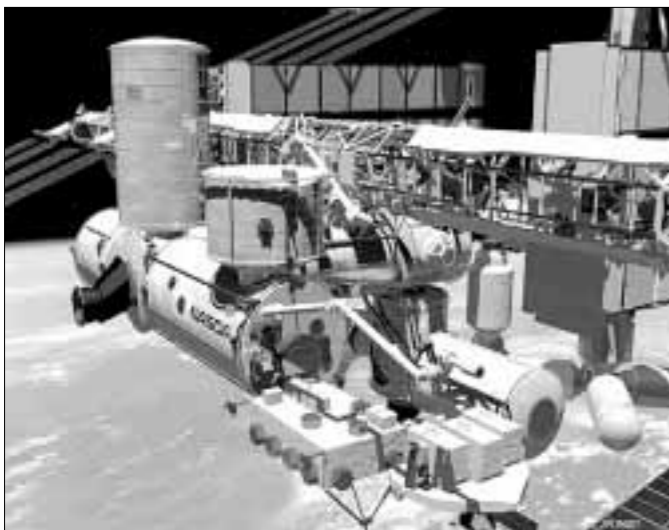
Cilj ovog uređaja je i pronicanje u prirodu vremena i njegovu međuovisnost s gravitacijom