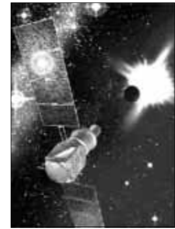
Jedan od teleskopa u potrazi za novom Zemljom

agencija planira i projekt koji je nazvan »Kepler«, a riječ je također o teleskopu koji bi bio u orbiti sunca i promatrao oko 100 tisuća zvijezda u roku od četiri godine. Naime, planete bi se otkrivala standardnom metodom tranzita, što bi značilo da prilikom prelaska planete preko zvjezdinog diska ona gubi na sjaju, a što teleskop zamijeti. Iz promjene u sjaju može se izračunati veličina planeta. Iz veličine i orbite znanstvenici bi mogli izračunati temperaturu, a iz nje postojanje vode. Ta bi misija na zadatku trebala krenuti iduće godine.